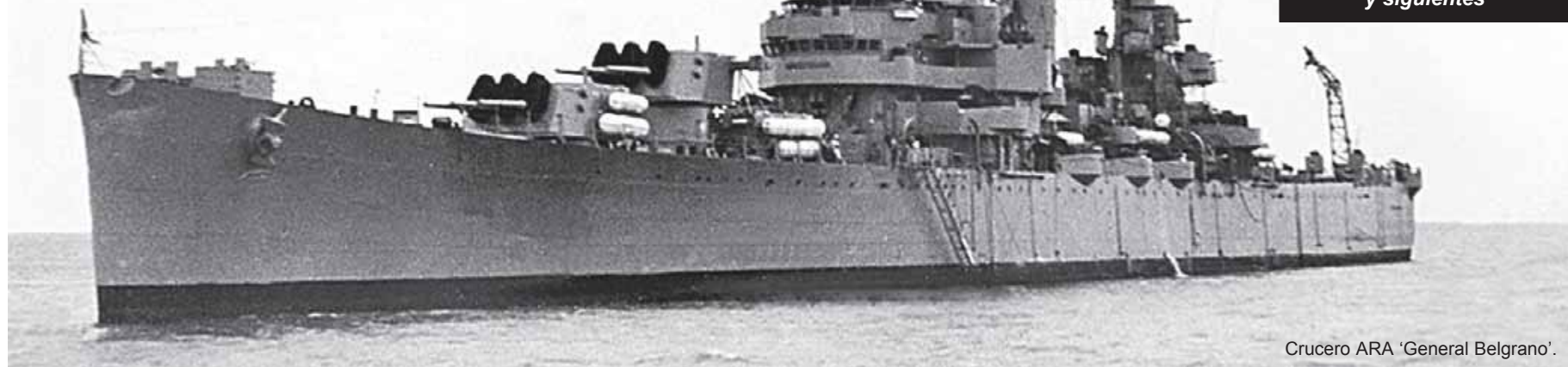
Crucero ARA 'General Belgrano'.