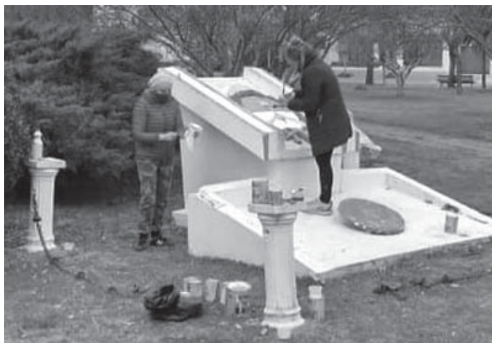
El escudo ahora

tóricas -y esta lo es- es una intervención que busca ante todo la recuperación respetuosa del patrimonio cultural de todos los quiroguenses. Los mismos aplausos y aprobaciones partieron del propio vecindario que lo reflejaron en redes sociales.