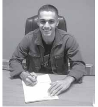
Puso la firma. Primer contrato profesional

El receso de los torneos oficiales, fundamentalmente el de Primera División, donde ambos juegan, a raíz de los partidos de la Selección Nacional por eliminatorias para el Mundial del año próximo y la disputa por la Copa América, les permitió a ambos pasar unos días en Quiroga, compartiendo horas con sus familias y amigos.