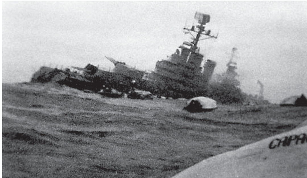
Imagen dramática cuando se hunde el Belgrano y las balsas alrededor.

El Conqueror siguió al Belgrano durante la noche entre el 1 y 2 de mayo a lo largo de una línea paralela a la Zona de Exclusión. El comandante del Conqueror, Christopher Wreford-Brown llamó a su Estado Mayor de Combate en