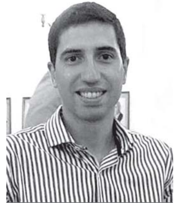
Por: Juan Pablo Parise (*)

El último gran eje que le cambiara la vida a miles de familias argentinas son las mil obras públicas que están en marcha en cientos de ciudades