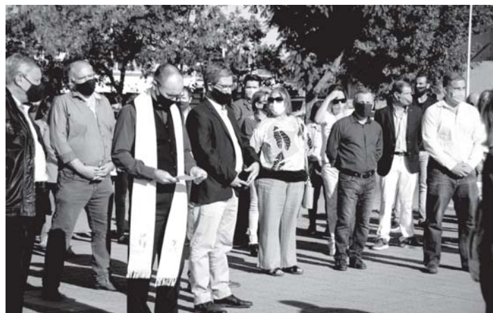
Público presente en el acto.

Los invito a reflexionar junto a los suyos en este día, a reflexionar sobre los valores de la vida, la tolerancia, el amor al prójimo y también sobre la estupidez de la violencia y de los violentos, para que nuestros hijos y nosotros mismos aprendamos a convivir en paz, aprendamos a perdonar, a no guardar rencor, a respetar a los demás, y así la vida en sociedad será cada día un poco mejor».